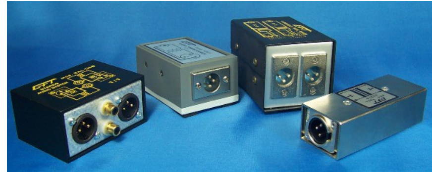
Le connessioni per gli Ingressi e le Uscite sono con connettori XLR, RCA